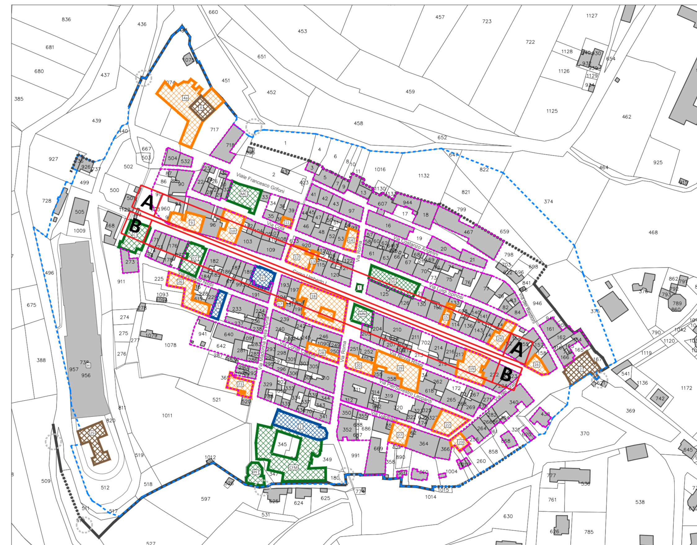
PLANIMETRIA ZONA A