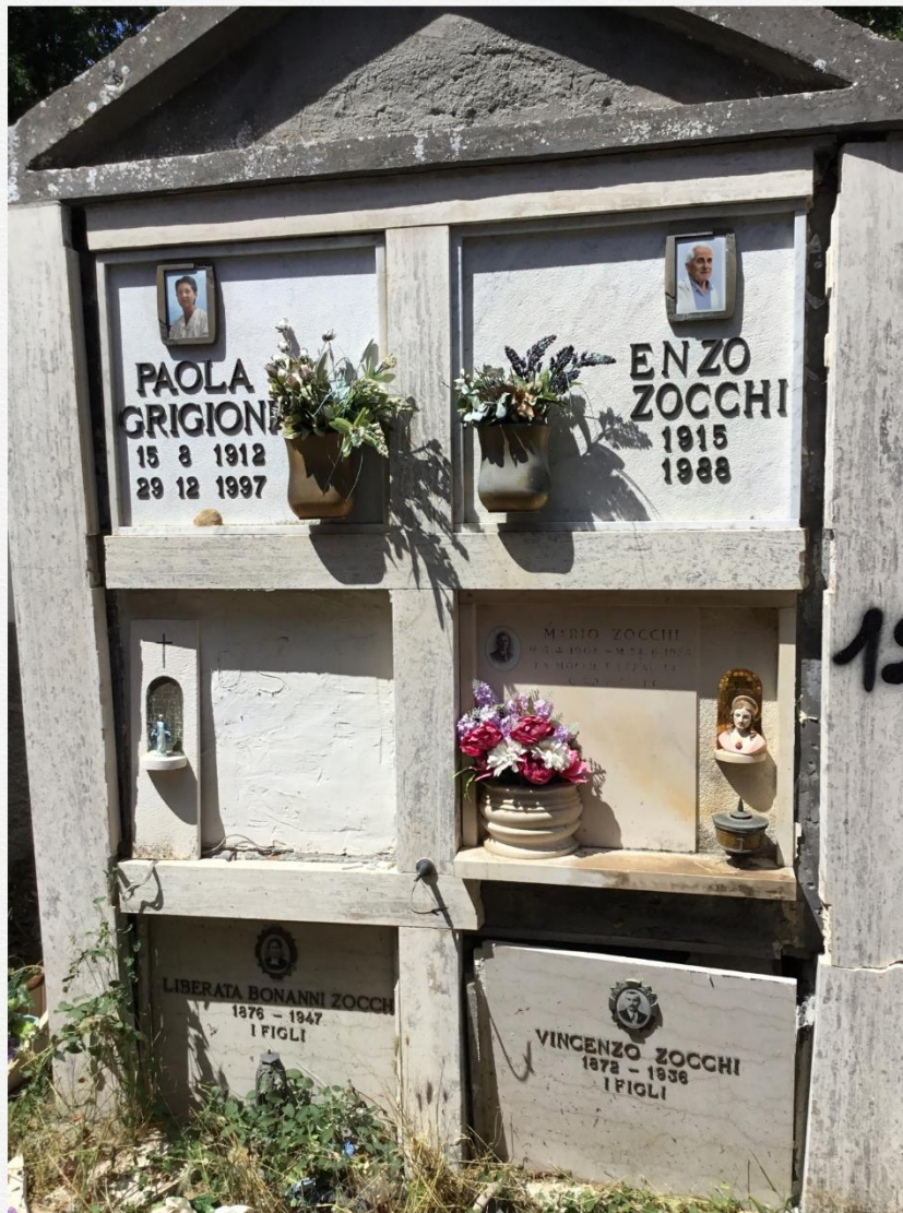
Cappella 12 zocchi

Tipologia: cappellina con loculi incolonnati, 2 colonne