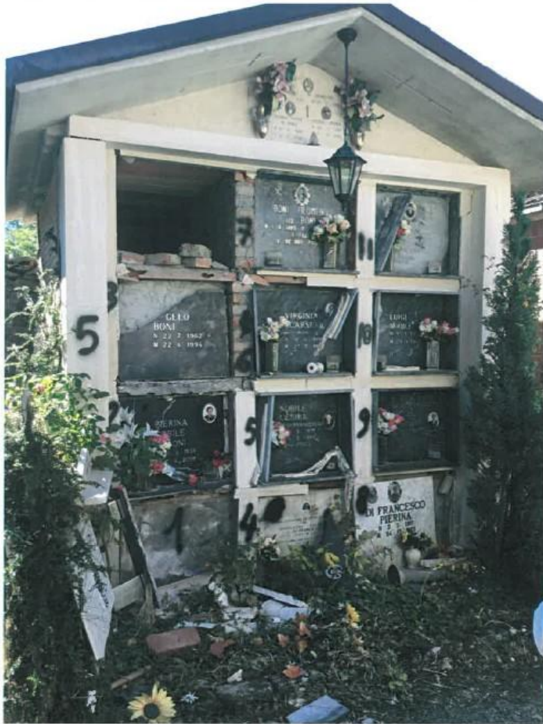
Cappella n. 5

Tipologia: cappellina con loculi incolonnati, 3 colonne