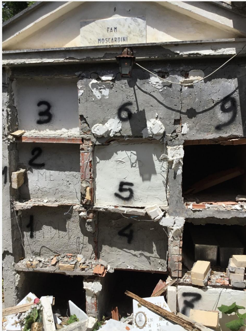
Cappella 11 moscardini

Tipologia: cappellina con loculi incolonnati, 3 colonne