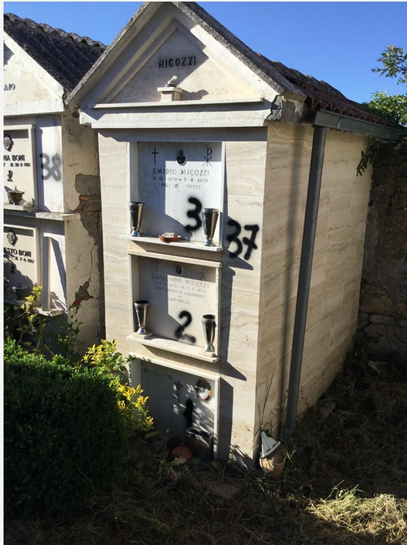
Cappella 37 fam. micozzi

1 ANACLETO MICOZZI 1916-1983 contenente interno loculo cassetina con ossa sconosciuta