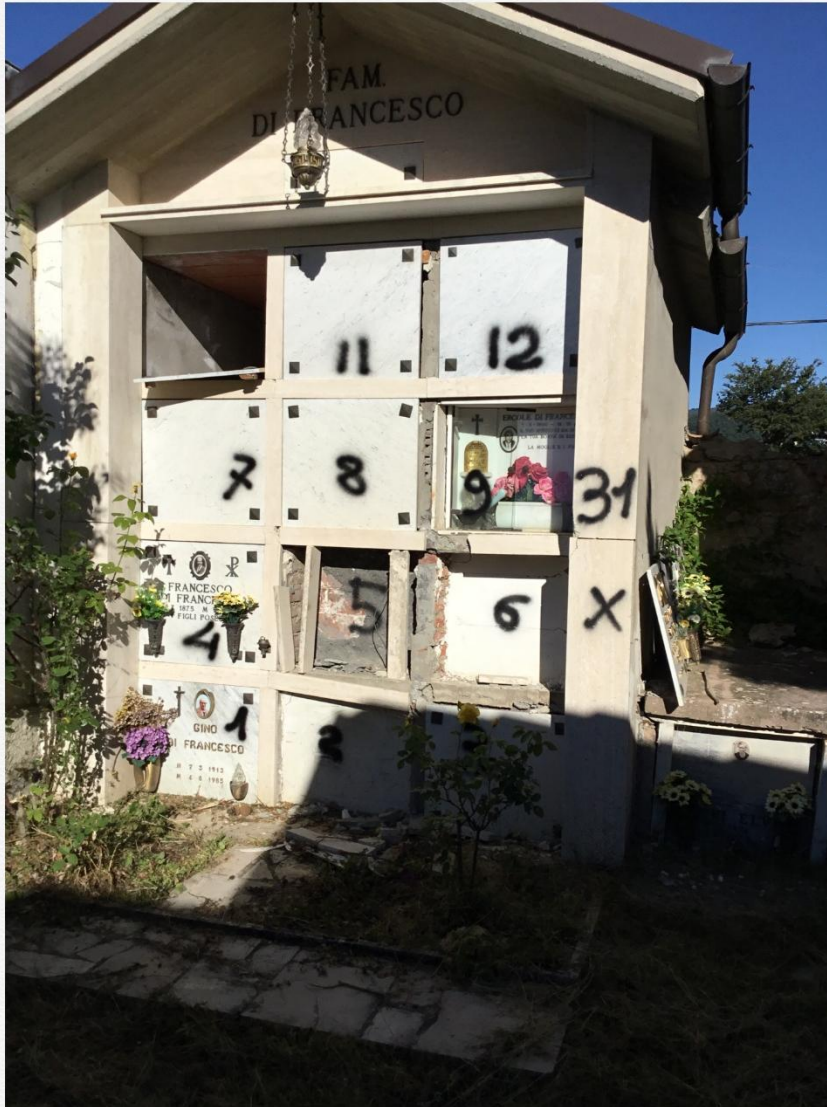
Cappella 31 FAM. DI FRANCESCO

Tipologia: cappellina con loculi incolonnati, 3 colonne