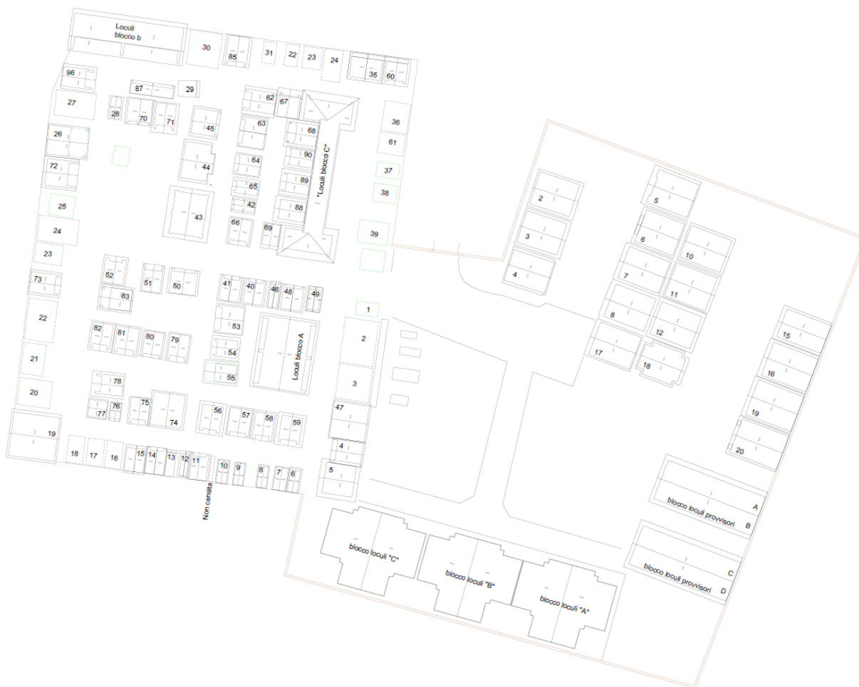
Cimitero di San Lorenzo e Flaviano – Individuazione manufatti da planimetria di rilievo